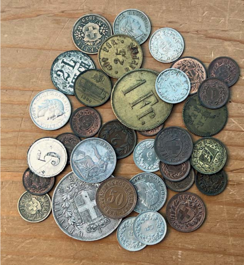
Abb. 1: So etwa könnte die Barschaft einer Familie um 1910 ausgesehen haben: Eidgenössisches Geld, vor allem Kleinnominale, ein 5 Lirestück aus Italien, Bier- und Milchmarken sowie anonyme Wertmarken und ein Tramjeton.

2009 veröffentlichte ich zusammen mit meinem Sammlerfreund Anton Riechsteiner das Buch über die «Biermarken der Schweiz 3) » mit mehr als 1100 Nummern, und weitere vier Jahre später folgten noch die «Milchmarken der Schweiz 4) » mit mehr als 2200 erfassten solchen Jetons.