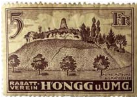
Abb. 3: Rabattverein Hönigg u. Umg. Vignette/Wertmarke zu 5 Fr. Ein seltenes Sammelgebiet, das Entdeckungen verspricht 6

Gerne lade ich Sie ein, mir weiterhin unbekannte Jetons mitzuteilen. Vielleicht ergibt sich die Möglichkeit, später ein neues Thema in Angriff zu nehmen.