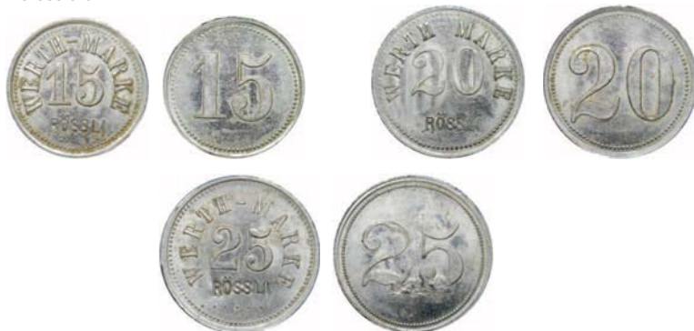
Abb. 2: Ursprünglich anonyme Wertmarken wurden mit dem gepunzten Namen eines Geschäfts oder einer Gaststätte versehen und so für den Eigenbedarf brauchbar gemacht; die wohl günstigste Methode eigene Wertmarken herzustellen. In diesem Fall Marken des Restaurants «Rössli» in Wynau, Kt. BE.

Im gesamten deutschsprachigen Raum ist die dazugehörige Literatur, mit löblichen Ausnahmen, weiterhin spärlich vorhanden, und auch für die Schweiz gilt, dass noch längst nicht alle Marken und Jetons anderer Verwendungsarten erfasst wurden, denken wir nur an die unzähligen übrigen Restaurantmarken, die nicht nur für den Bierausschank Verwendung fanden, sondern auch für Speisen oder alkoholfreie Getränke benützt wurden. Das könnte als zusätzliches Projekt weitere Sammlerkreise interessieren.