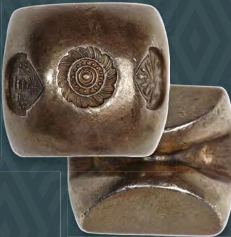
Thailand: Rama V (Chulalongkorn) 6-Piece Uncertified "Bullet" Presentation Set CS 1242 (1880) Uncirculated