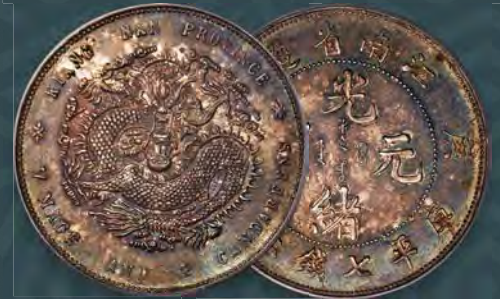
China: Kiangnan. Kuang-hsü Dollar CD 1900 MS65 PCGS

Heritage Auctions Europe Cooperatief U.A. Jacco Scheper | Managing Director