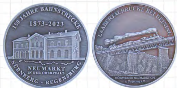
Vereinsmedaille 2023 des Münzvereins Neumarkt/Oberpfalz

Am 1. Juli 2023 jährte es sich zum 150. Male, dass die Bahnstrecke von Nürnberg nach Regensburg durchgängig befahren werden konnte. Bereits zwei Jahre zuvor war sie von Nürnberg nach Neumarkt befahrbar gewesen. Der Münzverein Neumarkt widmete diesem Ereignis seine Vereinsmedaille 2023. Abgebildet ist auf der Medaillenvorderseite das Bahnhofgebäude in Neumarkt von der Bahnhofstraße betrachtet. Die Rückseite zeigt die Laabertalbrücke bei Deining mit der Lokomotive der Bayerischen Ostbahn 1158 der Baureihe 5378. Bestellt werden kann die Medaille in Feinsilber oder Kupfer mit Patinierung im Durchmesser zu je 40 mm und einem Gewicht von 40 Gramm zum Preis von 145 oder 55 Euro (plus Portokosten) unter www.muenzverein-neumarkt.de oder unter Tel: 09181/6165).