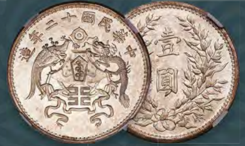
China: Republic silver Pattern "Dragon & Phoenix" Dollar Year 12 (1923) MS65 NGC