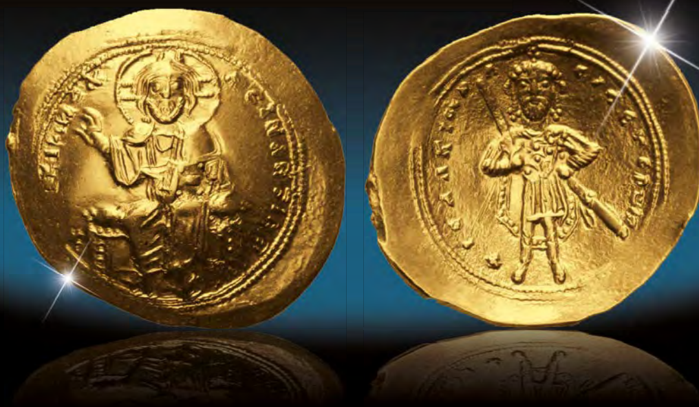
Isaak I., byzantinischer Kaiser von 1057 bis 1059 AV Histamenon Nomisma (Scyphat) Seltene Prägung mit thronendem Christus und stehendem Kaiser