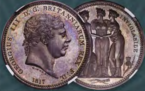
Great Britain: George III silver Proof Pattern "Three Graces" Crown 1817 PR63+ NGC

Highlights from Our Official HKINF Auction View all lots and bid at HA.com/3111