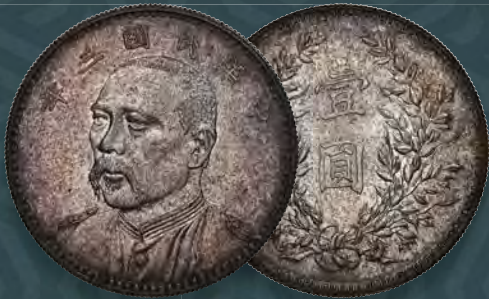
China: Republic Yuan Shih-kai silver Pattern Dollar Year 3 (1914) MS64 NGC