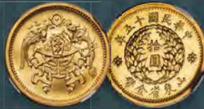
China: Shantung. Republic gold Pattern "Dragon & Phoenix" 10 Dollars Year 15 (1926) MS65+ NGC