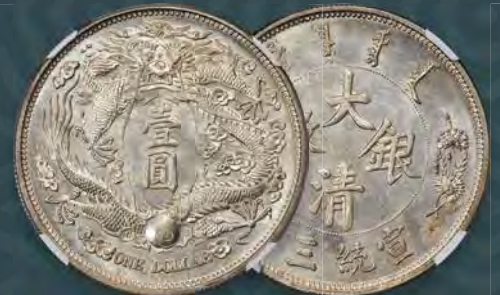
China: Hsüan-t'ung silver Specimen Pattern "Long-Whiskered Dragon" Dollar Year 3 (1911) SP64+ NGC