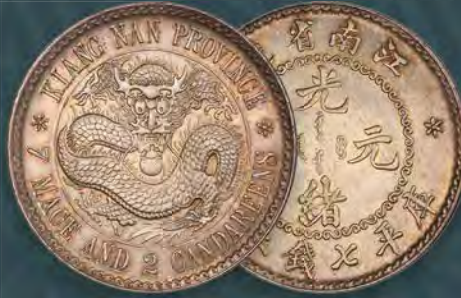
China: Kiangnan. Kuang-hsü Dollar ND (1897) MS63 PCGS