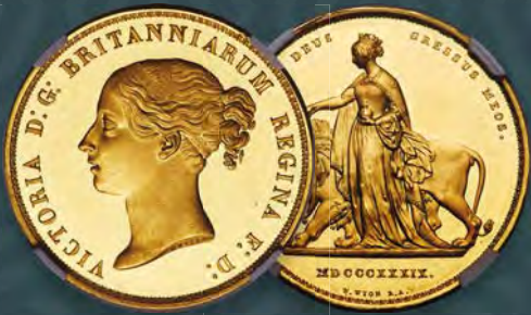
Great Britain: Victoria gold Proof "Una and the Lion" 5 Pounds 1839 PR62 Ultra Cameo NGC