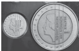
2 Euro Prägung aus dem Mini-KMS Niederlande 2002. Der Durchmesser des kleinen „Zweiers“ beträgt 13,15 mm. Im Bild der direkte Vergleich mit einer 2 Euro Umlaufmünze.

Die Königlich Niederländische Münze verkaufte bereits, als der Gulden noch Zahlungsmittel in den Niederlanden war, sogenannte „Mini-Muntsets“ an Sammler. Dabei handelt es sich um detailgetreue Nachprägungen der Münzwerte in Gulden in sehr kleinem Format. Gleiches erfolgte auch im Jahr 2002 mit den niederländischen Euro-Münzen. Der Verkauf des Satzes musste jedoch auf Druck der EZB eingestellt werden. Es handelt sich hierbei nicht um Münzen!