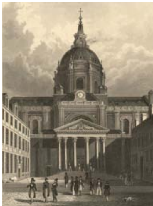
Das Hauptportal der Sorbonne in Paris auf einem Stahlstich um 1850 aus der Kunstanstalt Hildburghausen

Die Vergabe von Stiftungsbriefen durch beide Gewalten wurde im 15. Jahrhundert zur Regel. Nach der Reformation begnügten sich insbesondere die protestantischen Neugründungen in Deutschland wie Marburg, gegr. 1527, Jena gegr. 1559 und Helmstedt, gegr. 1575 mit dem kaiserlichen Brief. Wie für die meisten im 14. und 15. Jahrhundert gegründeten Universitäten waren auch für Prag und Wien, die beiden ältesten europäischen Universitäten Bologna gegr. 1088 und Paris gegr. um 1150 das Vorbild.