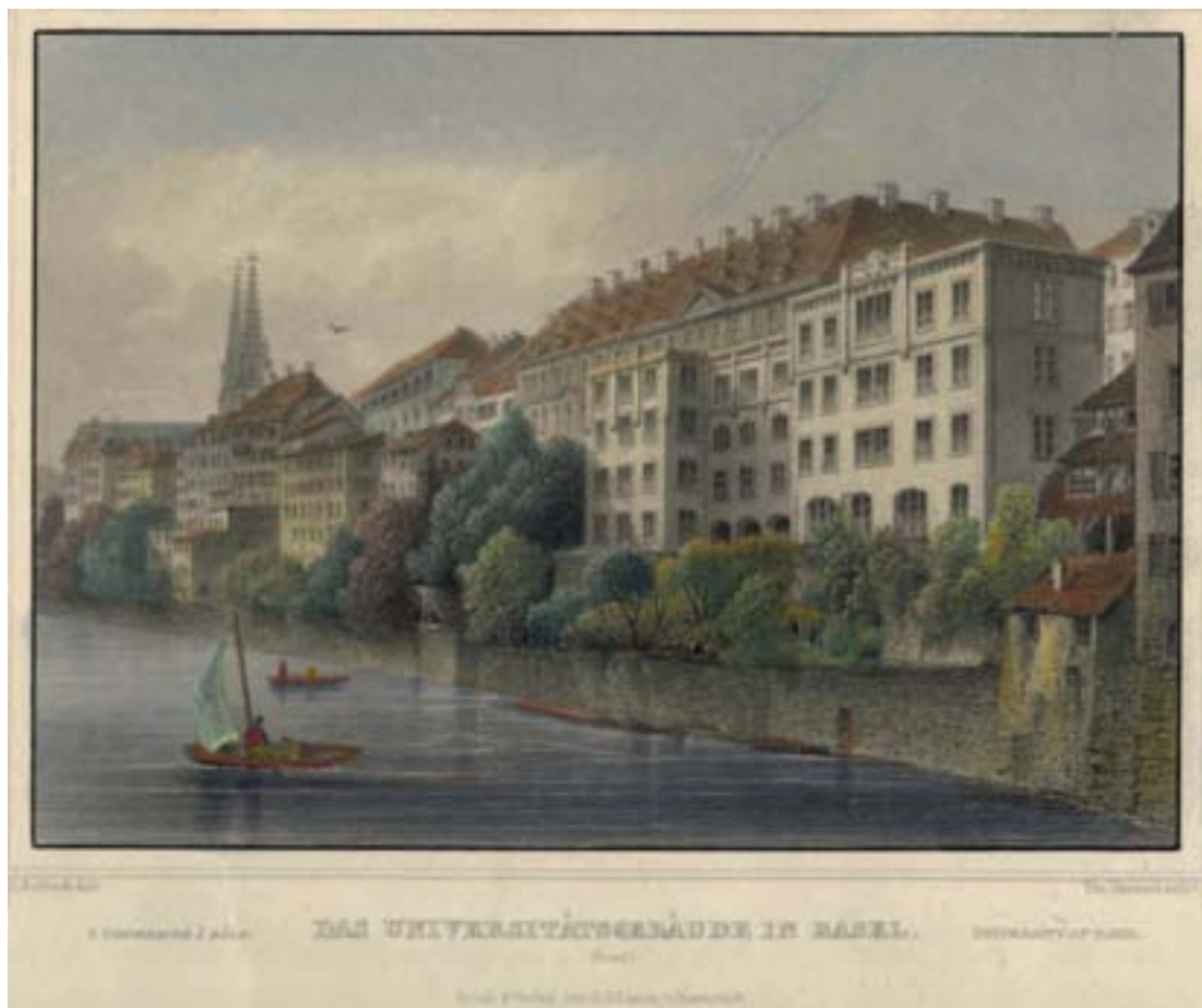
Das Universitätsgebäude am Rheinsprung in Basel auf einem kolorierten Stahlstich um 1860 von Tho. Heawood., erschienen bei Druck & Verlag G. G. Lange in Darmstadt.

Die Universität Basel ist die älteste und war bis ins 19. Jahrhundert die einzige Universität in der Schweiz. Sie wurde von Basler Bürgern 1459 als Stiftung gegründet und am 4. April 1460 im Basler Münster eröffnet. Die eigentliche Gründung erfolgte bereits 1432, ein Novum in der Geschichte der mittelalterlichen Universitätsgründungen, durch das Basler Konzil (1432/1448). Nach bescheidenen Anfängen schuf der 1439 vom Konzil als Gegenpapst gewählte Felix V. eine alle vier Fakultäten umfassende Hohe Schule, die im Oktober 1440 als „ Alma universitas studii curiae Romanae “ mit einer feierlichen Messe