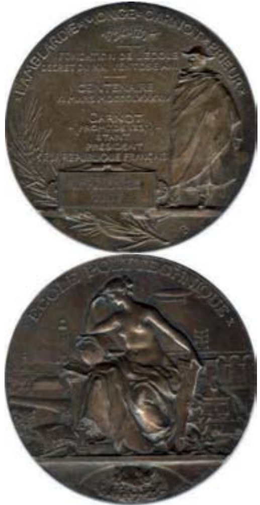
Medaille 1894 in Silber und Bronze Ø 68 mm auf die 100-Jahrfeier der Ecole Polytechnique in Paris von Max Borgeois